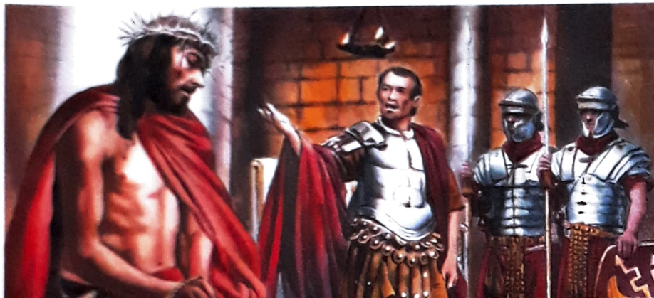
JESUS CRISTO, REI DO UNIVERSO